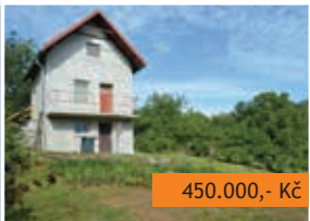
Chata 2+kk Boskovice