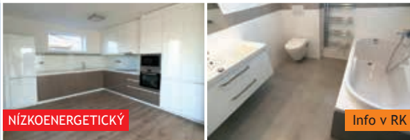
Novostavba RD 4+kk Knínice u Boskovic