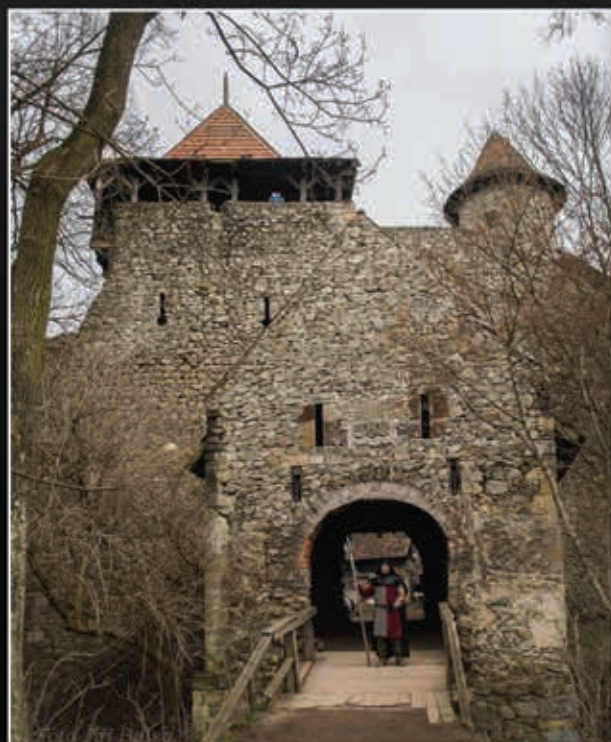
Nový hrad mezi Adamovem a Blanskem.