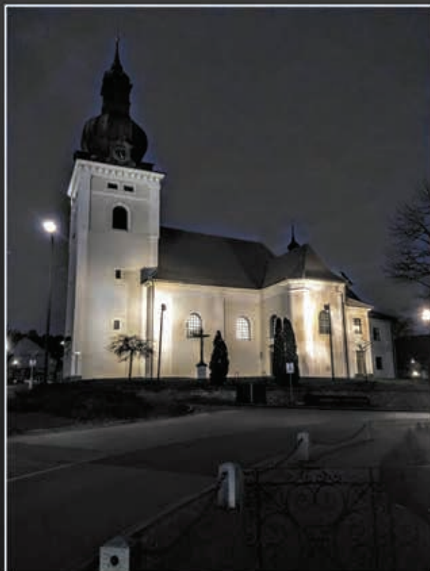
Kostel sv. Stanislava v Kunštátě.