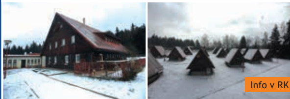
Penzion s kempem Suchý, pozemek 18.142 m 2