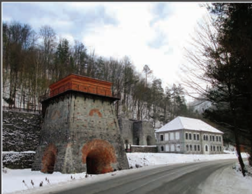
Stará huť u Adamova (Huť Františka).