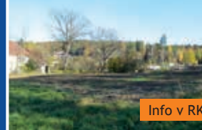
Stavební pozemek, komerce Boskovice, 2.679 m 2