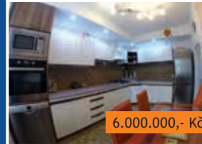
RD 4+1 Brno, Ivanovice