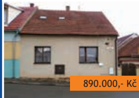
RD 4+1 Jevíčko, Horní