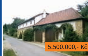
Venkovská usedlost 6+kk Slatina u Jevíčka