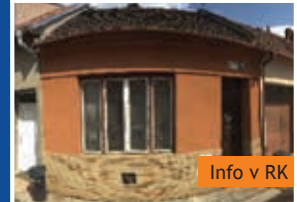
RD Brno, bratři Mrštíkú