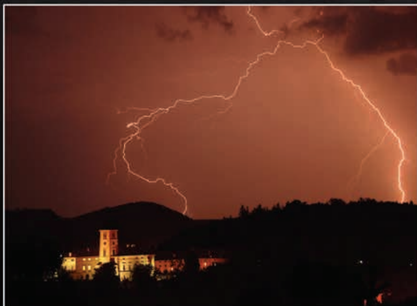
Blesk nad zámkem v Černé Hoře.