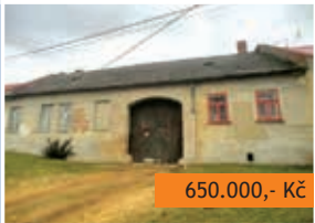
RD 3+1 Uhřetice