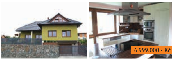
Novostavba RD 6+kk Boskovice, Na Chmelnici