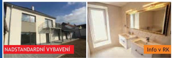
RD 4+kk Velenov