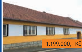
RD 3+1 Paměťice, pozemek 2.550 m 2