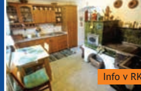
Venkovské stavení 6+1 Cetkovice